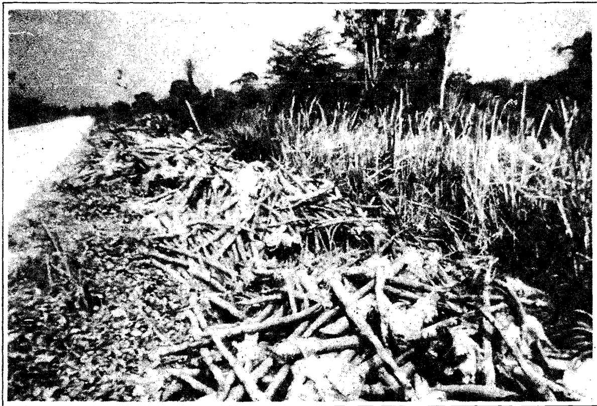
Fundas de polietileno y cujes para sostener la planta de banano amontonados a la orilla de un camino. Provincia de El Oro. Foto TH. Vogel, 1985.