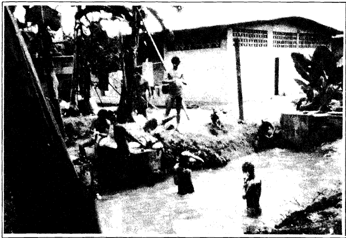
Trabajadores bañándose en un canal de aguas contaminadas con agroquímicos. Provincia de El Oro. 1985.