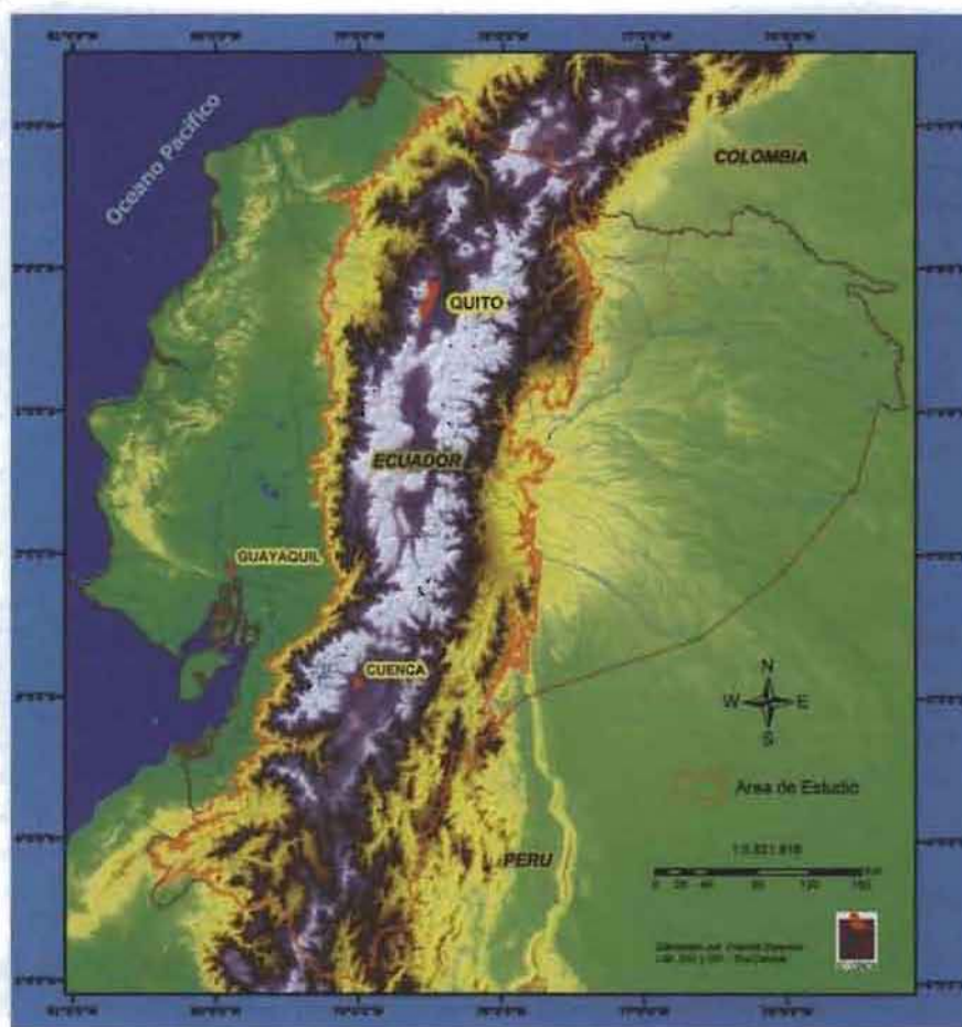
Figura 1. Ubicación del área de estudio

Los límites altitudinales del área de estudio son los siguientes: 400 m al occidente y 800 m al oriente. Estos valores fueron definidos considerando que a estas alturas promedio se producen los cambios florísticos entre los Andes, la Costa y la Amazonía (Figura 1). Sin embargo, es importante mencionar que la frecuencia de distribución de muchas especies puede estar por debajo de las alturas promedios mencionadas para el área de estudio. Éste es el caso de las especies andinas que se distribuyen hasta altitudes menores, pero con frecuencia muy escasa (Raven et al. 1992).