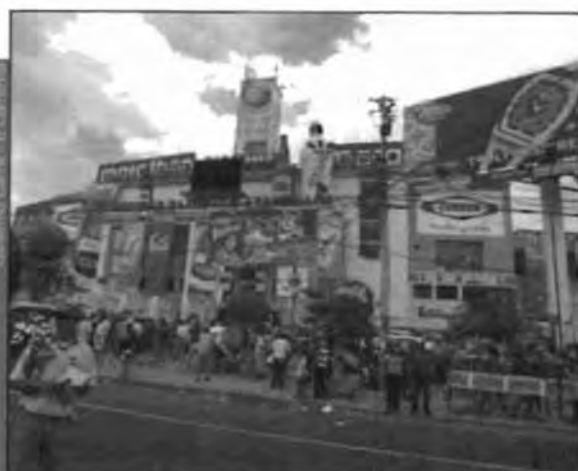
Era menester que bajo los tubos cilindros de tela en que ese horrible traje consiste, se afirmase el cuerpo del futbolista. Ortega y Gasset

preferencias regionales y nacionales. Este hecho no fue posible en un primer momento, ya que las preferencias locales aún tenían mucho peso en la población a nivel nacional y regional. Tuvo que pasar muchos años y décadas para que este hecho ocurra.