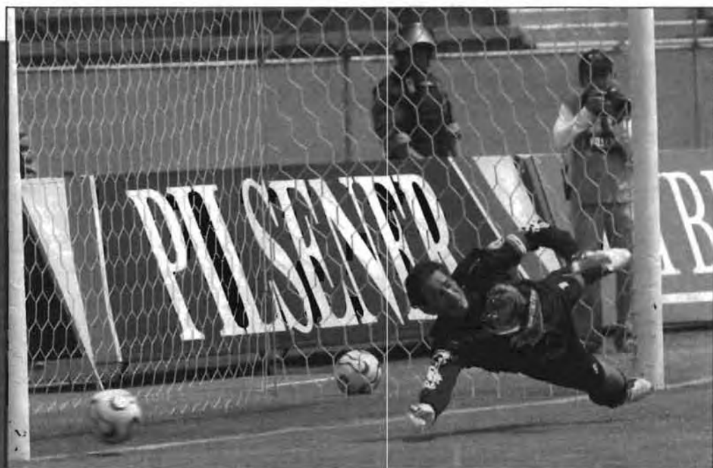
Eduardo Samián - El Comercio

La utilización de fútbol como máquina cultural productora de nacionalidad no es reciente sino que arranca en los años 20, de manera contemporánea a la máquina escolar. Pablo Alabarces