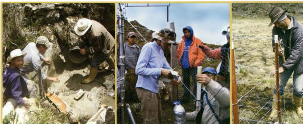
Fotos: Miembros de la comunidad en el cercado y adecuación de la estación climática, así como en la construcción del vertedero. Jornada demostrativa de los equipos de la estación, dirigida al comité de riego de Mixteque.

Para la instalación de los equipos y para el monitoreo de datos hidrológicos se contó con miembros de los comités de riego y otras personas de la comunidad, a quienes se les remuneró sus días de trabajo. El tiempo compartido durante la instalación de las estaciones se aprovechó para continuar conversando sobre la investigación, aclarando dudas y resaltando la importancia de la misma. La participación de los habitantes del páramo en esta fase fue clave para la simplificación de las actividades de instalación de los equipos. Por ejemplo, en el establecimiento de cercas, así como en la construcción del vertedero, que implicó el desvío temporal de la quebrada. Además se recibió en esos días de campo sus sugerencias, su conocimiento y su visión del ambiente páramo.