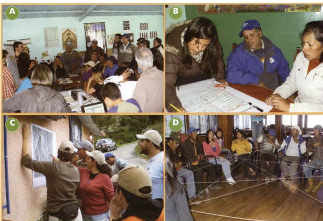
Fotos: Talleres de zonificación participativa en sitios piloto del Proyecto Páramo Andino Venezuela. A. y B. Discusión y definición del reglamento de la zonificación en la casa comunal en el Sitio Piloto Gavidia-Mixteque, Estado Mérida. C. Identificando y ubicando los problemas ambientales en el sitio piloto Tuñame, D. Tejiendo entre todos un sueño conjunto para la comunidad y sus páramos Sitio Piloto Tuñame, Estado Trujillo.

La base para el proceso de zonificación fue la información recolectada durante el trabajo de mapeo participativo, donde los miembros de la comunidad trabajaron sobre imágenes satelitales o fotos aéreas de alta resolución impresas en gran formato, identificando los ecosistemas presentes (páramos, pantanos, arbustales), los linderos de las fincas, el uso para cada sector de las mismas. En estos mismos talleres y con la ayuda de facilitadores locales, los participantes llenaron encuestas sobre las prácticas de manejo en las fincas y sectores (ej. pastoreo, fertilización, uso de agroquímicos, prácticas alternativas, etc.) y sobre las condiciones socioeconómicas y la calidad de vida en sus hogares.