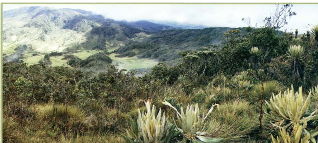
Foto: Vegetación del páramo de Santa Inés (SP Belmira, Colombia).

En el contexto colombiano la mayoría de comunidades de páramo se encuentran atomizadas, tienen poco sentido de pertenencia y enfrentan duras condiciones económicas, por estos motivos impulsar prácticas de manejo sostenible de los recursos de uso común como el agua, resulta un reto que se presenta como tarea de largo aliento. Sin embargo, el sentido político de líderes y gestores comunitarios es un punto a favor en cualquier tipo de proceso que involucre manejo del territorio.