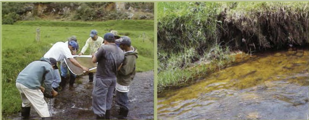
Fotos: Taller con los gestores locales en la Quebrada Toruro, Vereda Toruro, Municipio de Entreríos, SP Belmira, Departamento de Antioquia.

Se destaca haber logrado el objetivo principal de lo planificado: un grupo de líderes locales formados en el monitoreo de la calidad y cantidad de agua de las sub-cuencas en el Páramo de Belmira y su fortalecimiento para el co-manejo del agua.