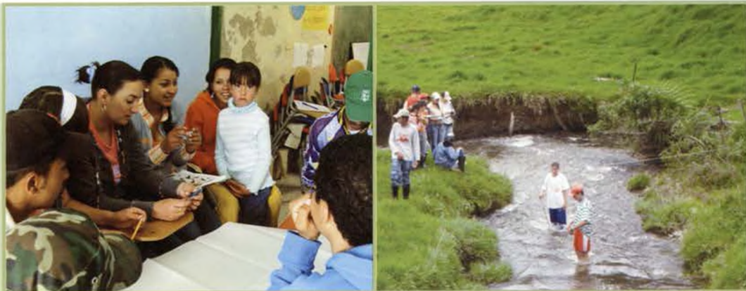
Fotos: Monitoreo de calidad biológica realizado por los gestores locales en la quebrada Torura. Vereda Torura, Municipio de Entrerrios. Sitio piloto Belmira. Departamento de Antioquia.

Lograr que el trabajo comunitario sea sostenible en el tiempo, requiere la organización de la comunidad en torno al manejo colectivo de su recurso hídrico, para lo cual se debió fortalecer los espacios de elección colectiva y abrir nuevos, además de capacitar a un grupo de gestores locales en las metodologías de monitoreo de agua e incentivar la creación de reglas para su manejo (Ostrom, 2000).