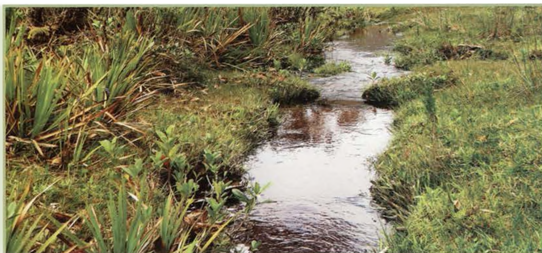
Foto: Riachuelo en el páramo de Santa Inés (SP Belmira, Colombia).

Los parámetros analizados por el laboratorio fueron: Coliformes totales, DBO total, DQO total, Escherichia coli , Fosfatos, Nitratos, Oxígeno disuelto, pH, Sólidos totales y Turbiedad.