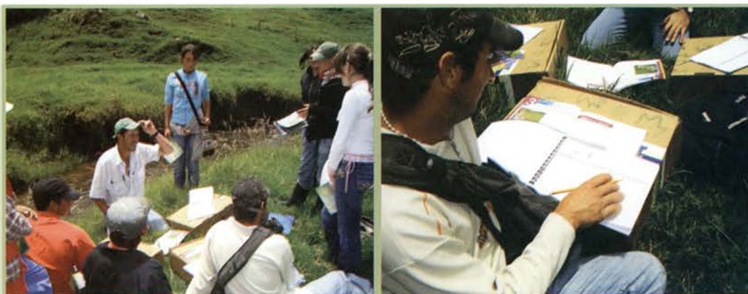
Fotos: Taller con los gestores locales de la Quebrada Torura. Vereda Toruro, Municipio de Enterríos. Sitio piloto Belmira. Departamento de Antioquia.

Para 2011 se priorizaron 4 cuencas más, para un total de 7 en las que se trabajó monitoreo de calidad y cantidad y bioindicadores con macroinvertebrados (contrastando los resultados con las pruebas de laboratorio de calidad de Corantioquia), ahí todavía no están vinculados al Proyecto Piragua, arrancan en 2012, pero la red Piragua adopta la metodología planteada por PPA.