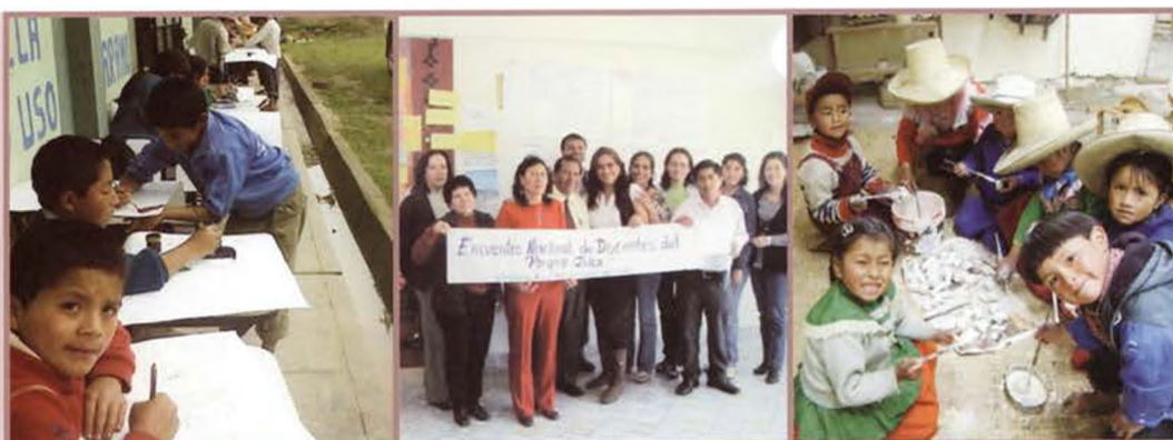
Fotos: (Izquierda) Niños de la escuela de San Juan, Pacaipamba, Piura. Dibujando en actividad del PEA Producción y reforestación con plantas nativas. (Centro) Docentes de los sitios piloto de Piura y Cajamarca y autoridades educativas regionales. (Derecha) Niños de la escuela de Sexemayo, Cajamarca. Actividad del PEA Manejo de residuos sólidos.

En nuestro país, en el año 2005, el Ministerio de Educación – MINEDU emite la Resolución Ministerial N° 0667-2005-ED, considerando que la educación ambiental debe ser contemplada como eje transversal en la Educación Básica Regular – EBR, con el objetivo de analizar y reflexionar sobre la problemática ambiental a nivel local, regional, nacional y mundial, para que los estudiantes identifiquen y analicen de manera participativa sus causas, consecuencias y propongan soluciones y alternativas a los problemas y amenazas desde el enfoque educativo. En el año 2007, el MINEDU, emite la directiva N° 014-2007-DINECA-AEA, creando la Dirección Nacional de Educación Comunitaria y Ambiental – DINECA, con el objetivo de proponer normas, estrategias y acciones de educación ambiental para el desarrollo sostenible, en coordinación con las Direcciones Regionales de Educación - DRE, las Unidades de Gestión Educativa Local - UGEL, las Instituciones Educativas - IE, con participación de la sociedad civil.