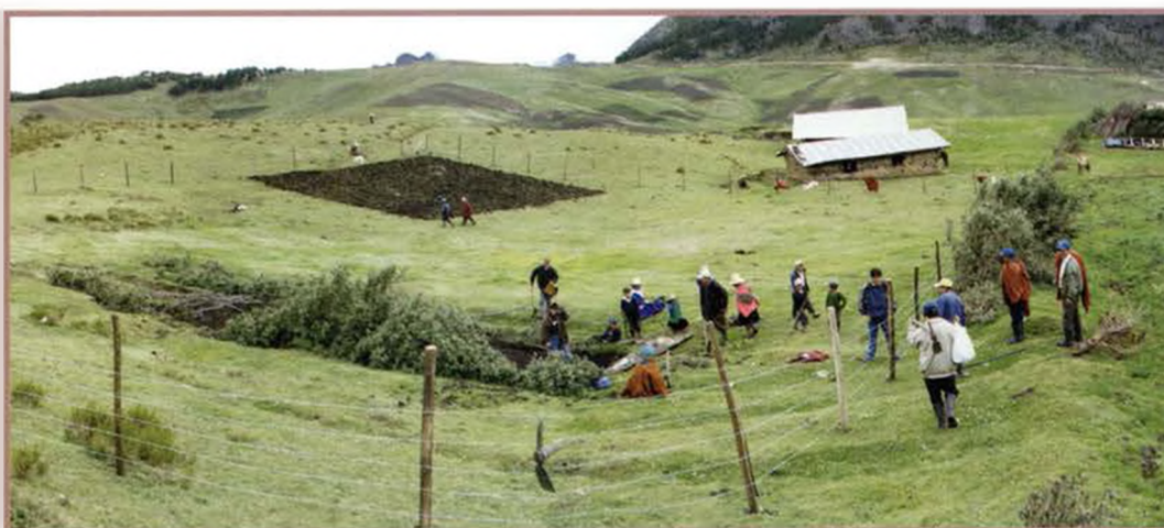
Foto: Comuneros de Cajamarca trabajando en su parcela.

El enfoque de valoración y aprovechamiento del conocimiento local del agricultor ha sido la razón para impulsar y realizar intercambios de experiencias y pasantías, las cuales motivan y fortalecen el trabajo de los participantes, con un efecto multiplicador hacia otros pobladores.