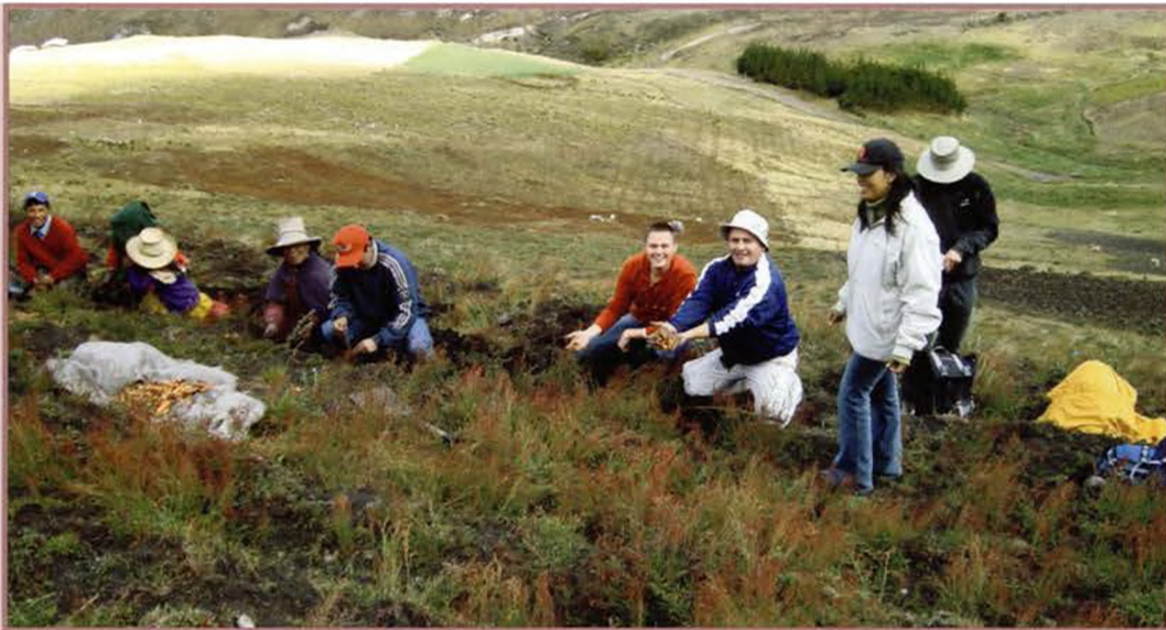
Foto: Técnicos y comuneros en labores de cosecha en Cajamarca.

Sin embargo el acompañamiento técnico todavía es necesario. Es necesario monitorear campañas productivas completas y por varios periodos para así comparar la productividad y rendimiento, ajustando las prácticas de manejo agroecológico que sean necesarias.