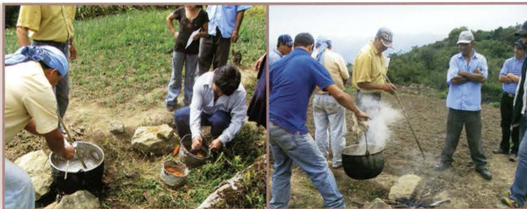
Fotos: Extracción de tinturas de plantas del páramo.

Luego de que se priorizó la implementación de parcelas agroecológicas en la asamblea comunal, se procedió a identificar a las familias que voluntariamente quisieran comprometerse con esta novedosa actividad.