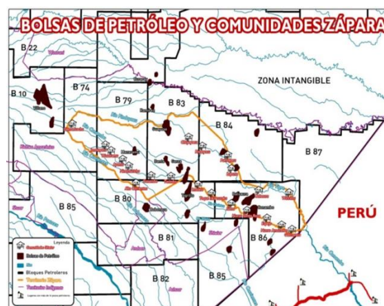
Mapa 2: Territorio sapura con bloques de la XI Ronda petrolera

En gran parte de la provincia de Pastaza, Napo y Morona Santiago la Subsecretaría de Hidrocarburos lideró el proceso de consulta , y la publicitó como un proceso exitoso de participación masiva de la ciudadanía en 17 bloques y en sus resultados 30 convenios firmados y 115 millones de dólares en acuerdos de inversión, contraídos con comunidades, organizaciones de nacionalidades o con juntas parroquiales (Vallejo, 2014).