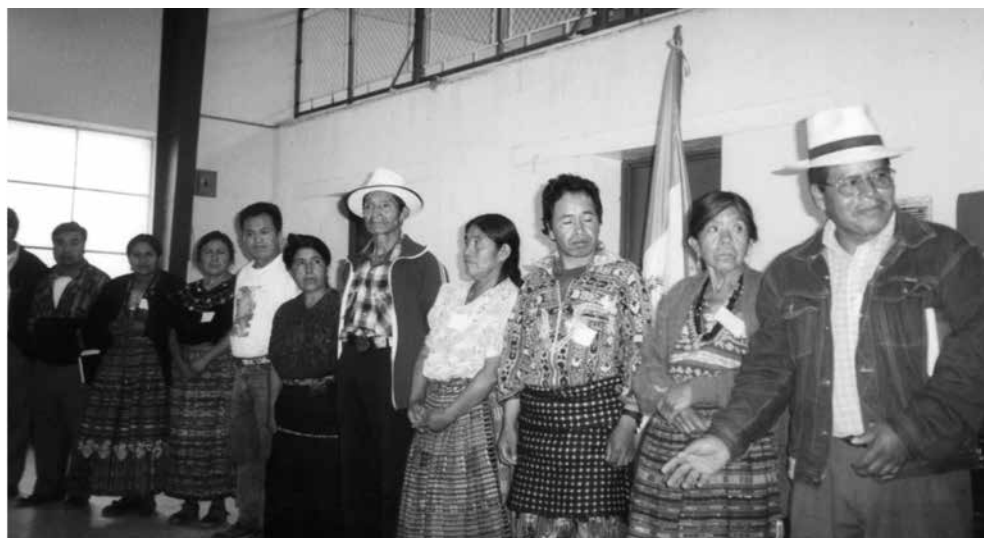
Junta directiva de la mesa departamental de concertación de Sololá

Fuente: Junta directiva de la mesa departamental de concertación de Sololá electa en mayo de 2002, integradas por 11 indígenas y un miembro no indígena. Foto tomada por la autora.