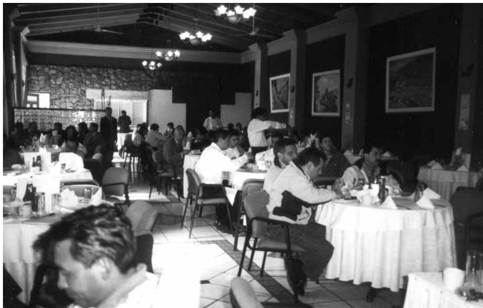
Encuentro con candidatos

Fuente: Encuentro con candidatos a alcalde y diputado de cinco partidos y movimientos políticos, medios de comunicación y organizaciones de la sociedad civil, organizado por la mesa departamental de Quetzaltenango el 11 de septiembre de 2003. Foto tomada por la autora.