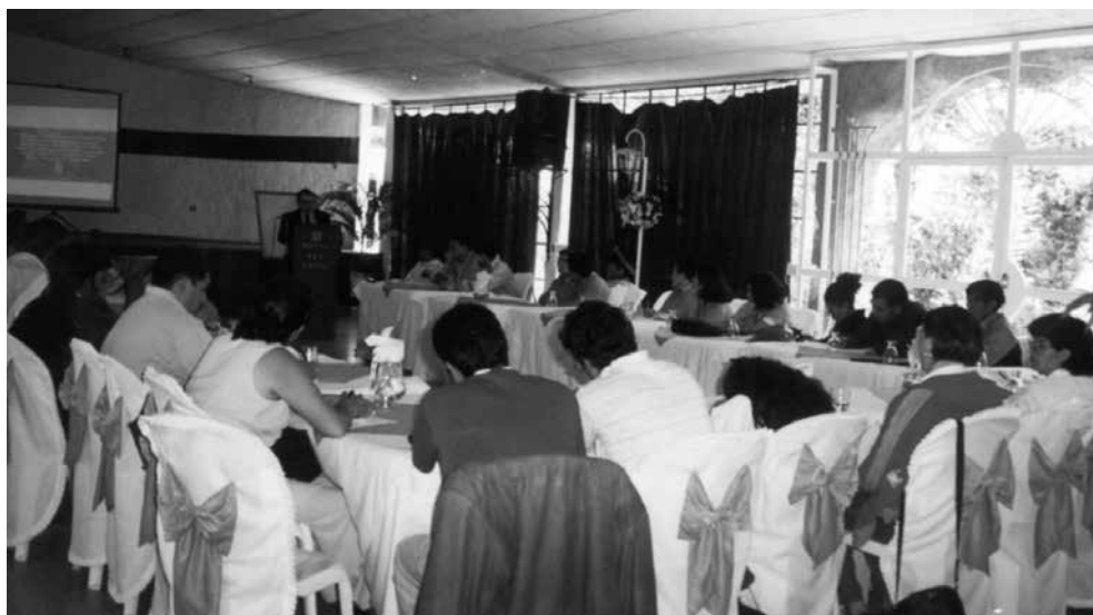
Asamblea de la mesa departamental de concertación de Huehuetenango

Fuente: Asamblea de la mesa departamental de concertación de Huehuetenango con la participación de representantes de la Comisión Presidencial sobre Descentralización y de la Comisión Presidencial sobre Derechos Humanos el 25 de abril de 2002. Foto tomada por la autora.