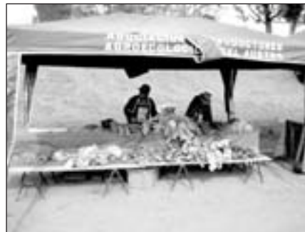
Dos productores del grupo Bajo Invernadero vendiendo hortalizas.