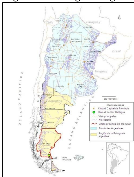
Figura No. 1 Región de la Patagonia argentina y provincia de Santa Cruz