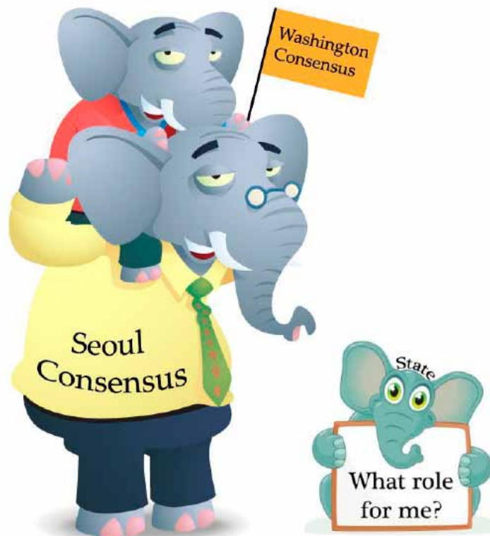
"Consenso de Washington - Consenso de Seúl"