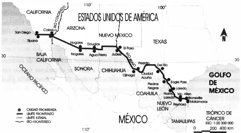
Figura 1. Sistema de ciudades fronterizas México-EE.UU.

Este es un fenómeno bastante similar —aunque a una escala distinta— al que existe en la frontera de México con los Estados Unidos. En este caso se ha formado una vasta red de ciudades binacionales en constante interacción transfronteriza, donde sobresalen los binomios San Diego-Tijuana, El Paso-Ciudad Juárez y McAllen-Reynosa, que forman parte de no menos de 25 pares de ciudades que se integran en esta lógica de la intermediación regional en el sistema urbano. De las ciudades mexicanas, hay ocho que tienen más de medio millón de habitantes, cada una de las cuales se articula con sus pares de los EE.UU. bajo lógicas asimétricas y complementarias.